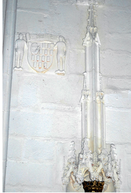
Figure 7 – Pontivy, chapelle Notre-Dame de La Houssaye, armoiries à droite de la maîtresse-vitre

le déplacement du jubé et l'agrandissement du chœur. Cette évolution, loin d'être un exemple isolé se rencontre dans de nombreuses églises et chapelles bretonnes à la fin du xv e siècle, comme à Saint-Fiacre du Faouët où se retrouve un phénomène semblable. Cet accroissement de la surface du chœur liée à l'implication croissante de la noblesse dans la construction des édifices religieux en Bretagne tout au long du xv e siècle témoigne de l'augmentation de son emprise dans l'espace intérieur des édifices. Ainsi les bras de transept et les deux chapelles privatives de La Houssaye, augmentées de la partie orientale de la nef devaient participer d'un système de hiérarchie interne pouvant accueillir, en plus du suzerain et de sa famille, différentes familles de la noblesse locale 5 . Il est vraisemblable que le bras nord, situé du côté de l'évangile – le plus noble – abritait la chapelle de Rohan, ce que confirment