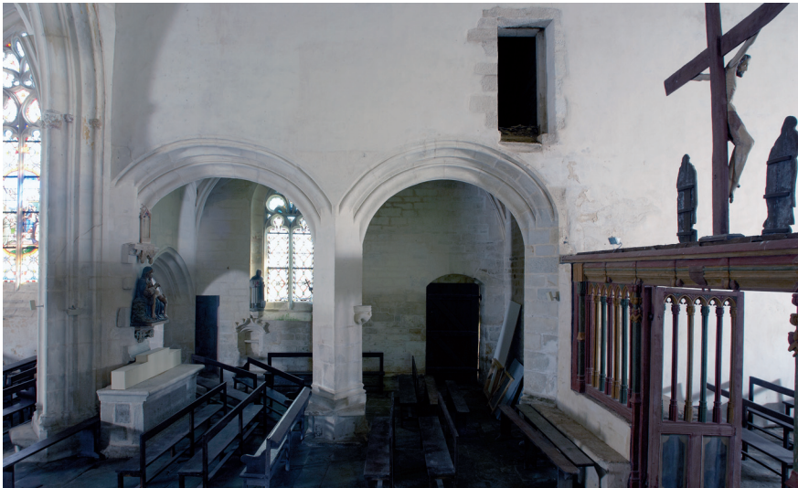
Figure 5 – Pontivy, chapelle Notre-Dame de La Houssaye, vue vers le collatéral sud