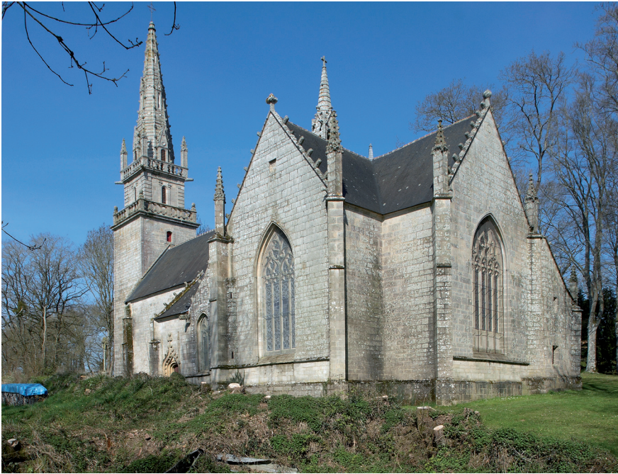
Figure 1 – Pontivy, chapelle Notre-Dame de La Houssaye, vue générale prise du sud-est