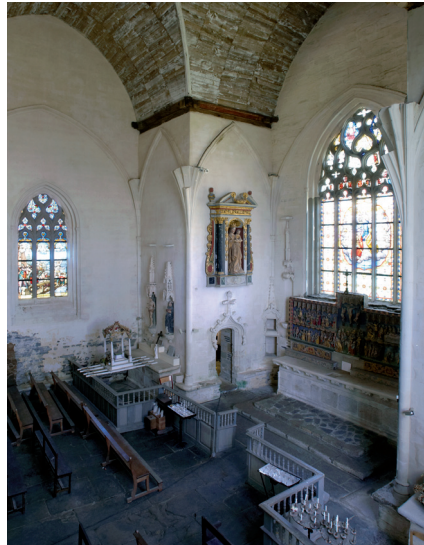
Figure 4 – Pontivy, chapelle Notre-Dame de La Houssaye, vue générale du chœur depuis le bras sud