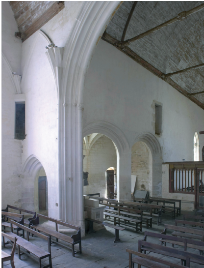
Figure 3 – Pontivy, chapelle Notre-Dame de La Houssaye, vue biaisée vers le bras sud et le collatéral sud.