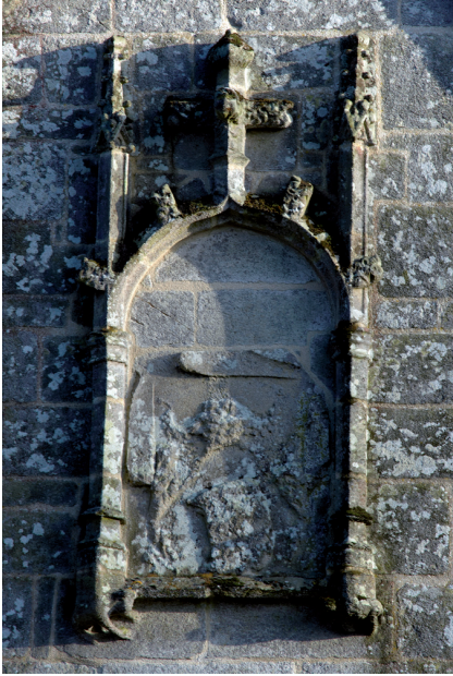
Figure 6 - Pontivy, chapelle Notre-Dame de La Houssaye, armoiries au sommet du pignon du bras nord