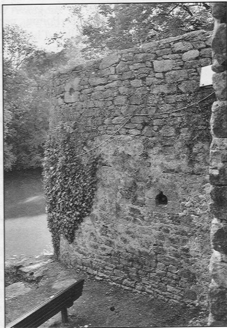
Figure 1 – Vestiges de l'enceinte urbaine.

L'attentat provoque l'indignation générale dont tire habilement parti la duchesse Jeanne qui prend la tête des forces loyalistes, convoque des états généraux à Vannes et ordonne la levée de troupes, 18 000 hommes selon l'estimation la plus vraisemblable d'A. de La Borderie, pour occuper les villes des Penthièvre et les confisquer «par (pour) cas de félonnie et crime de lèze-majesté». Richard de Bretagne, frère de Jean V, est un des instruments du «vengement de l'offense». Il occupe Clisson et le château tenu par une garnison de «plusieurs Bretons nos subggers, résistans et désobeissans à nous et à notre justice». La population fait montre de davantage de loyauté 24 . La ville ouvre ses