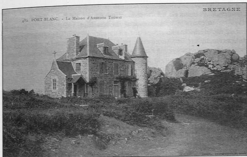
«Château d'Ambroise Thomas», sur l'île Illiec, à Buguélès. La chapelle est le petit bâtiment surmonté d'une croix.