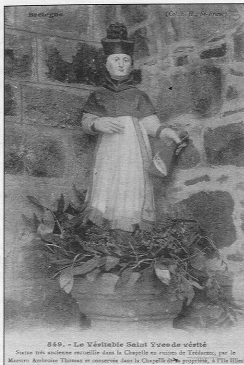
549. - Le V é ritable Saint Yves de v é rit é Statue tr è s ancienne recueillie dans la Chapelle en ruines de Tr é darzac, par le Ma î tre Ambroise Thomas et conserv é e dans la Chapelle de sa propri é t é , à l'île Illiec

Craignant probablement que saint Yves – ou tout au moins sa statue ! – ne se soit quelque peu assoupi dans la solitude de son oratoire isol é , le premier soin de la p è lerine é tait de le « r é veiller », afin de s'assurer de sa parfaite attention : en d é pit de son profond respect pour le saint, elle n'h é sitait pas à recourir à une certaine violence, prenant la plus petite des deux statues par l' é paule pour la secouer violemment, en pronon ç ant fortement la phrase rituelle d'adjuration. Puis, elle jetait brusquement une poign é e de clous rouill é s, appelant la mort sur la partie en tort, afin qu'elle « rouille » elle-m ê me et tombe à son tour en pouss é re. Enfin, paroxysme de la c é r é monie, les parties é taient d é finitivement li é es apr è s que l'officiante, se saisissant d'une al è ne de cordonnier, l'ait par trois fois plant é e dans le bois de la statue, en prof é rant ces mots : « Pa'z out ar Juge Braz, clew a-ho ñ ! !»